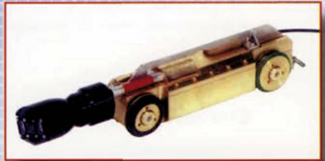
Kamerafahrwagen für die Untersuchung von Rohrnetzen