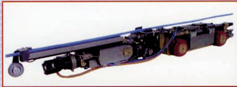
Kabelverlegeroboter zur Verlegung von Glasfaserkabeln in Rohrnetzen.